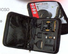
Kit INFORAD MOTO