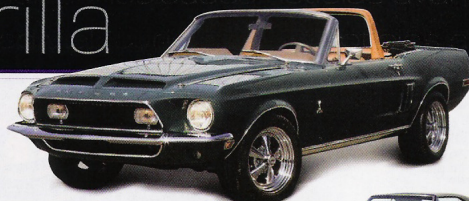
Shelby Mustang GT 500 Convertible 1968

Según los Presupuestos Generales del Estado para 2009, la DGT espera recaudar unos 416 millones de euros en multas y sanciones, un 15,5% más que este año. Además, retirará el carné de conducir a 250.000 conductores. Tráfico aumentará esta recaudación gracias a la implantación de nuevos radares, ya que final de 2008 estarán en activo unos 500 fijos. Una cifra que subirá a 1.500 entre 2009-2011.