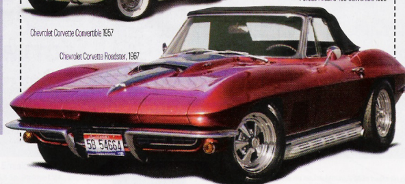
Chevrolet Corvette Roadster, 1967