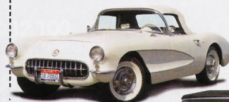
Chevrolet Corvette Convertible 1957

El actor Bruce Willis ha decidido sacar a subasta su gran colección de coches de varias marcas y todas las épocas. Entre sus joyas podemos encontrar un Chevrolet Corvette Convertible de 1957, un regalo de la entonces su esposa Demi Moore o el Shelby Mustang con el que Steve McQueen protagonizó la película Bullitt en 1968. La gran subasta tendrá lugar en Los Ángeles el 25 de octubre y todos los datos están en internet www.Bonhams.com/us . Hay modelos desde 30.000 a 175.000 dólares.