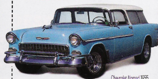
Chevrolet Nomad 1955